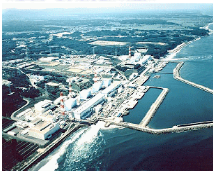
福島第一原子力発電所の全景

福島第一原子力発電所は、福島県の太平洋に面した通称“浜通り”と呼ばれる地域の、大熊町と双葉町にまたがって設置されています。